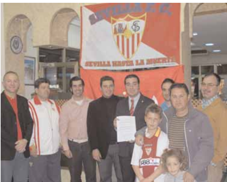
INTEGRANTES De la Peña Sevillista de Granada