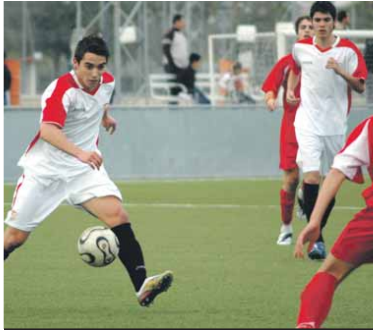
LIGA NACIONAL En la ciudad deportiva esta temporada