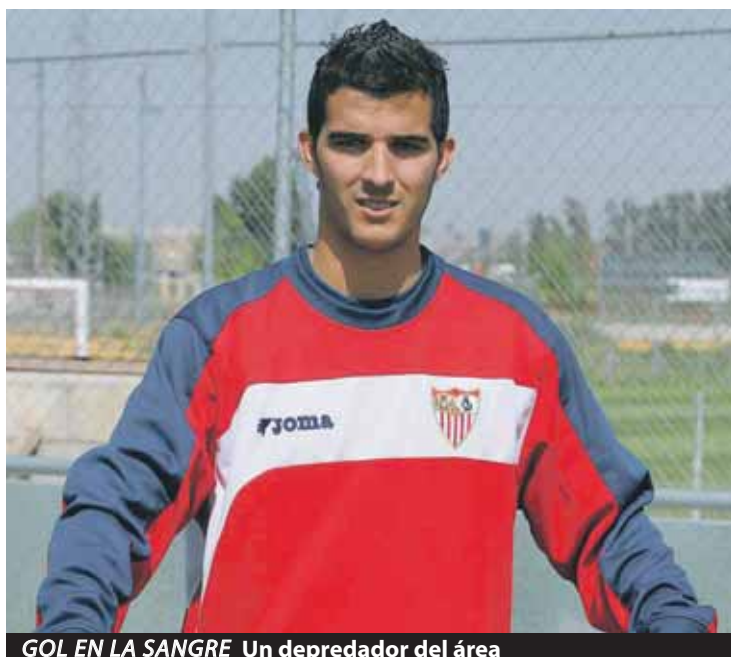
GOL EN LA SANGRE Un depredador del área