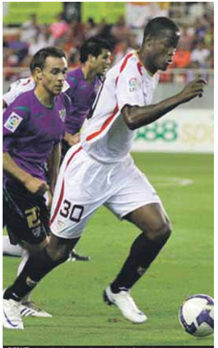
DEBUT Con el primer equipo en el I Trofeo A. Puerta