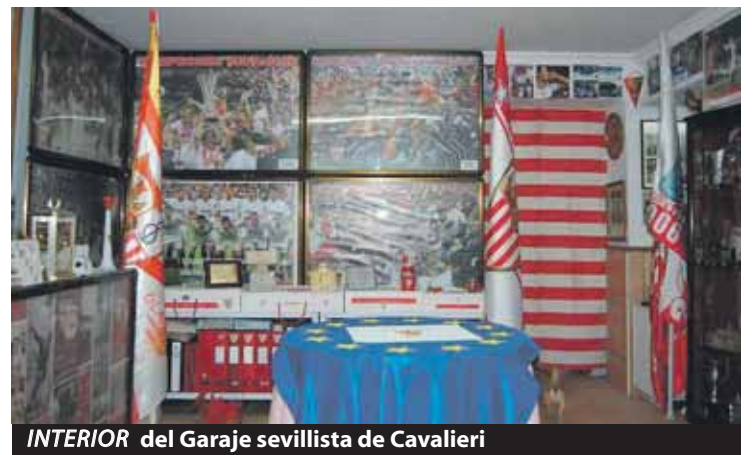
INTERIOR del Garaje sevillista de Cavalieri