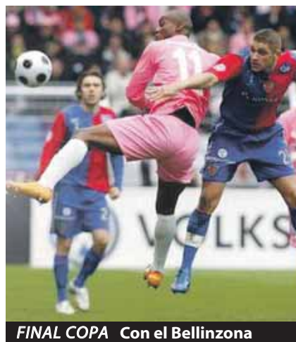
FINAL COPA Con el Bellinzona