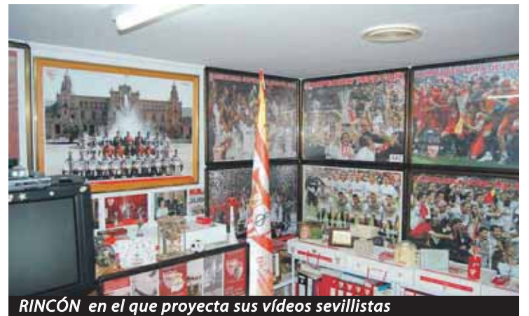
RINCÓN en el que proyecta sus vídeos sevillistas