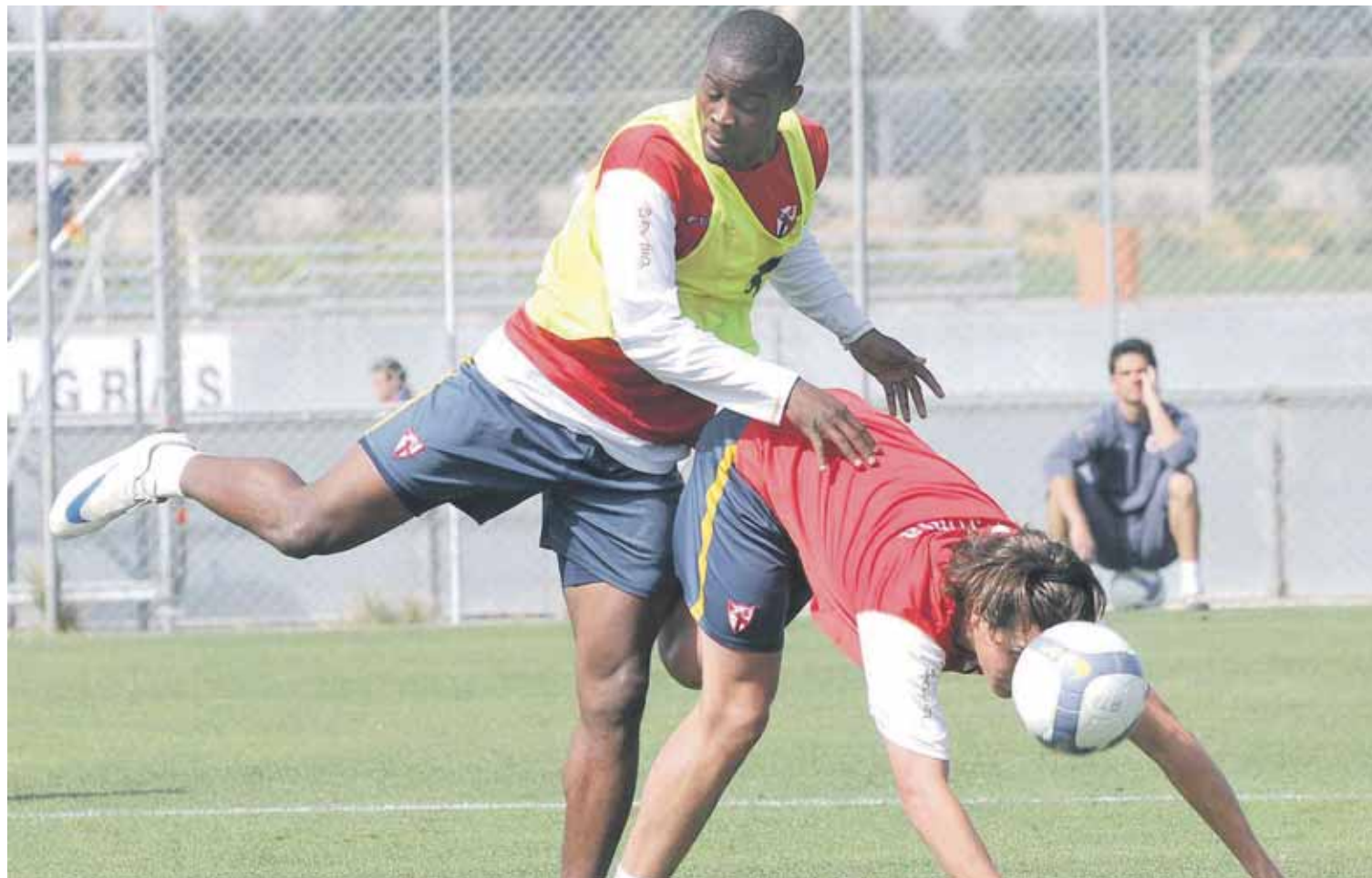
PUGNA Por un balón en la ciudad deportiva