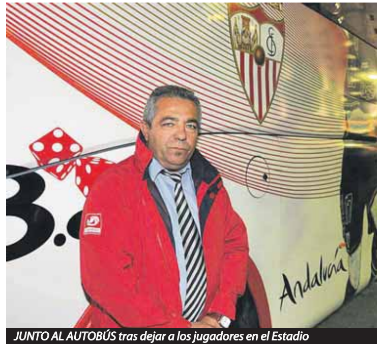
JUNTO AL AUTOBÚS tras dejar a los jugadores en el Estadio