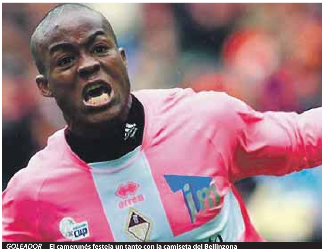
GOLEADOR El camerunés festeja un tanto con la camiseta del Bellinzona