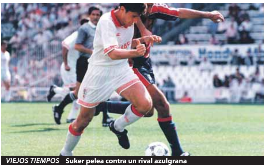
VIEJOS TIEMPOS Suker pelea contra un rival azulgrana

he nacido para jugar aquí, pero me siento agradecido porque Dios ha querido que así sea", reconoce, cuando contesta esta pregunta, para luego admitir que nota el cariño de la afición en todo momento en su transcurrir diario: "Siento que la gente me quiere, me recuerda a cada instante que con mis goles les hago ser felices y lo agradecen continuamente. Me recuerdan que he metido goles en todas las finales, me siento halagado por todo ello".