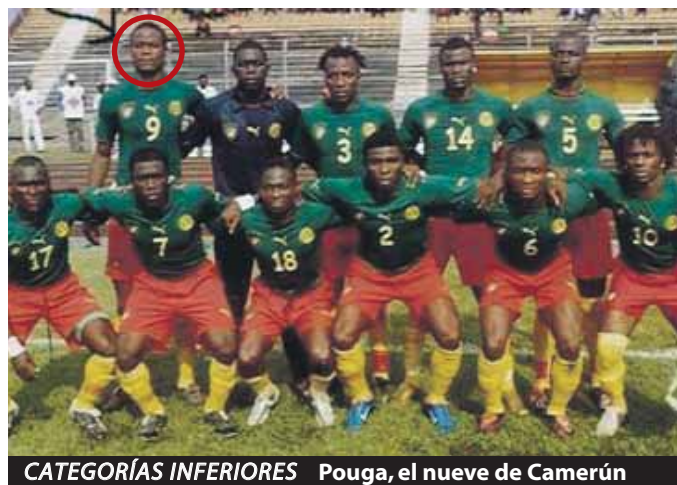
CATEGORÍAS INFERIORES Pougá, el nueve de Camerún