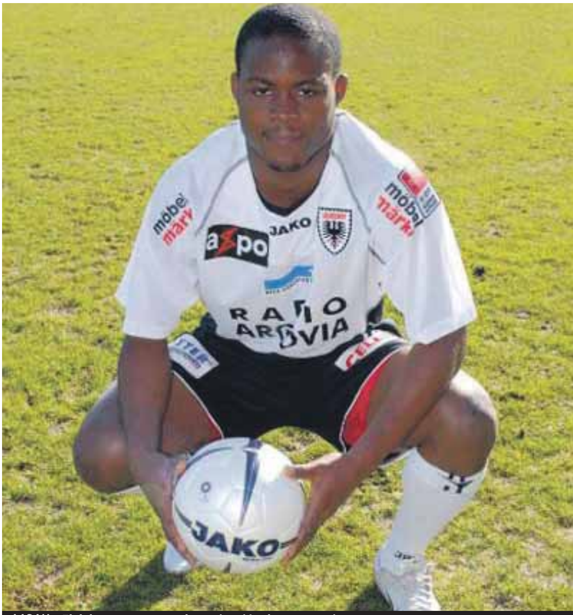
AARAU El delantero posa con la equipación de su ex equipo